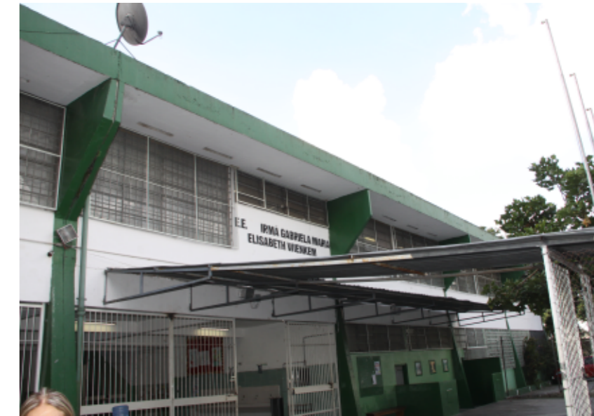
Escola Estadual Irmã Gabriela Maria Elisabeth Wienkem, no Jardim Padroeira, uma das escolas que deverão receber melhorias.

Escola Estadual Professor João Baptista de Brito, na Vila Yara, Escola Estadual Professor Horácio Quaglio, no Jardim Platina, Escola Estadual Professor Benedicto Caldeira, na Vila Jaguá, e Escola Estadual Professor José Maria Rodrigues Leite, na Vila Campesina.